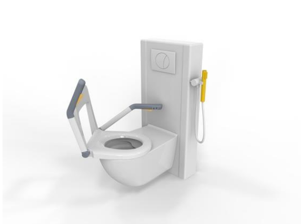
Figur 1: En mekanisk løsning på toalettskålen gjør at toalettsetet enkelt kan vendes 290 grader.

Det finnes i dag svært mange baderom, både i private hjem, omsorgsboliger og på helseinstitusjoner, som i liten grad er tilrettelagt for mennesker med særskilte behov. Det trengs ny teknologi og innovative løsninger som ivaretar disse brukergruppene på en bedre måte.